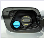
Système fluide d'échappement diesel